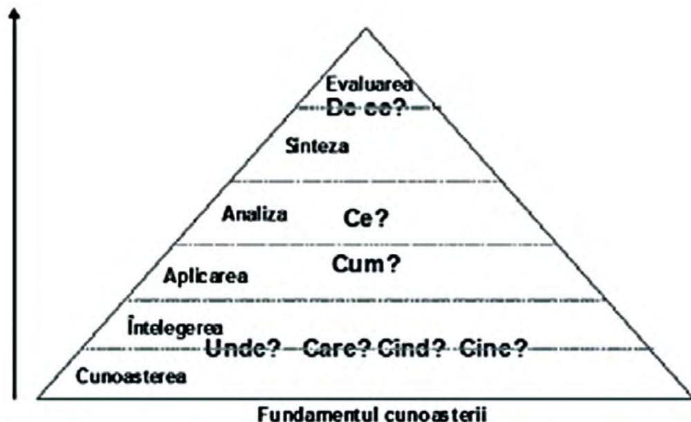
Figura 1. Nivelele întrebărilor

Deseori, în loc de a se face referire la un nivel specific al taxonomiei, se folosește termenul de întrebări la „nivelul de jos” și la „nivelul înalt”. Întrebările la „nivelul de jos” sunt întrebările la nivelul taxonomiei de cunoaștere, înțelegere și nivelul simplu de aplicare. Întrebările la „nivelul înalt” sunt întrebările care cer o aplicare completă (abilitați de analiză, sinteză și evaluare). (Figura 1.)